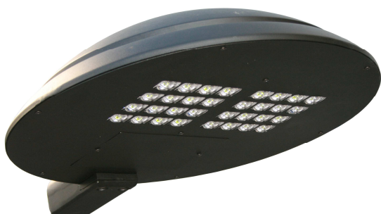
Oprawa uliczna COSMO LED

Diody LED współpracują z kolimatorowymi układami optycznymi wykonanymi z PMMA. Diody zamontowane są na płaskiej powierzchni radiatora poprzez paski podłoża MCPCB, na których znajdują się obwody drukowane oraz elementy wyodrębniające uszkodzoną diodę z obwodu. Konstrukcja oprawy składa się z tłoczonych profili oraz blach, wykonanych ze stopów aluminium o doskonałych właściwościach przewodności cieplnej (>200W/mK). Obudowa oprawy jest anodowana, co znacznie zwiększa odprowadzenie ciepła poprzez radiację.