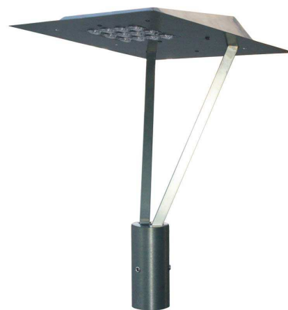
Oprawa parkowa MIRA LED

Poza parametrami technicznymi oraz innowacyjną technologią firma ROSA przykłada dużą wagę do estetyki wykonania swoich wyrobów. Z tego też względu seria ROSA LED została zaprojektowana tak, aby różnorodność dostępnych modeli zapewniała możliwość ich adaptacji w dowolnym otoczeniu. W ofercie znaleźć można zarówno klasyczne wzory jak i nowoczesne formy. Poza tym większość z nich wykonana jest z aluminium, które może być anodowane w 12 dostępnych kolorach, co dodatkowo podnosi ich walory estetyczne. Do opraw ROSA LED zaprojektowano także serię słupów, które idealnie pasują do charakteru każdej z nich. Całość stanowi wspaniałe uzupełnienie miejsca, w którym zostanie zamontowana i nada mu niepowtarzalny klimat.