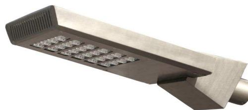
Oprawa uliczna URSA LED

Podstawową zaletą oświetlenia LED jest jego oszczędność w porównaniu do tradycyjnych źródeł światła. Przy takim samym strumieniu światła, źródła LED zużywają mniej energii niż tradycyjne lampy – dla przykładu nowa oprawa uliczna LED o mocy 96W osiąga porównywalną efektywność świetlną jak dotychczas produkowana oprawa sodowa o mocy 150W. Przy zastosowaniu produktów ROSA LED zużycie energii w skali roku zmniejszy się nawet dwukrotnie.