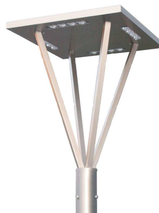
Oprawa parkowa MIZAR LED

Źródłem światła w serii ROSA LED jest jednostrukturalna dioda CREE XM-L o przełomowym strumieniu 280 lumenów z jednego chipu, osiągająca wydajność powyżej 137lm/W przy zasilaniu jej prądem 700mA. Dioda ta zapewnia strumień światła o wartości 700 lumenów przy prądzie zasilania 2A, co odpowiada 60-watowej konwencjonalnej żarówce, utrzymując przy tym wydajność powyżej 100 lm/W. Ponadto cechuje ją bardzo mała rezystancja termiczna wynosząca 2,5 °C/W oraz współczynnik oddawania barw powyżej 75.