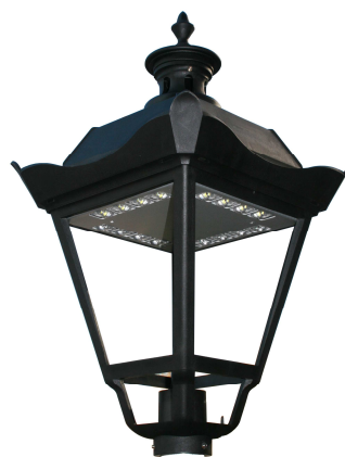
Oprawa parkowa OS-1 LED

W trosce o środowisko naturalne oraz bezpieczeństwo użytkownika położono duży nacisk na rozwiązania proekologiczne. Przede wszystkim diody LED nie emitują promieni UV ani promieniowania podczerwonego. Co więcej produkty z serii ROSA LED zużywają mniej energii, powodując zmniejszenie emisji dwutlenku węgla przez producentów energii elektrycznej. Ponadto w procesie produkcji wykorzystano materiały odnawialne, głównie aluminium, które mogą być łatwo przetworzone ponownie w wielu procesach produkcyjnych.