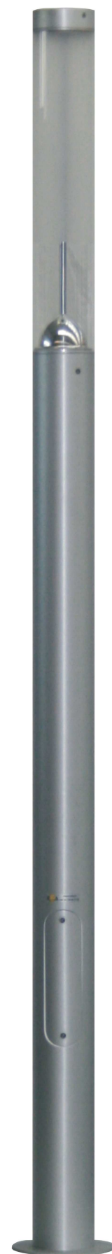
KARIN LED 3600