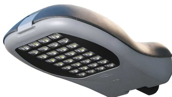
Oprawa uliczna ANDROMEDA LED

Oprawy z serii ROSA LED spełniają wymagania pod kątem normy PN-EN 62471 „Bezpieczeństwo fotobiologiczne lamp i systemów lampowych”, co oznacza, że nie powodują uszkodzenia wzroku w normalnych warunkach użytkowania. Produkty te są także zgodne z Dyrektywą RoHS, która wprowadza ograniczenia na etapie produkcji we wprowadzaniu substancji niebezpiecznych oraz innymi Dyrektywami związanymi z oświetleniem i elektryką. Ponadto zgodnie z polityką przeciwdziałania „zanieczyszczaniu nieba światłem” światło z opraw ROSA LED skierowane jest wyłącznie w dół.